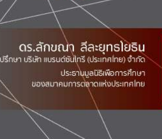
ดร.ลักขณา สิละยุทธิโยธิน ทีมนักบริหาร บริษัท แบริน (ประเทศไทย) จำกัด ประธานมูลนิธิเพื่อการศึกษา ของสมาคมการตลาดแห่งประเทศไทย